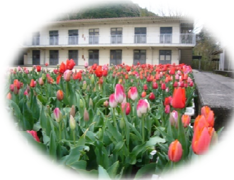
1年生の時に植えたチューリップ

卒業おめでとう あっという間の3年間、生徒会に、クラブ活動とすごく頑張っている姿を頼もしく思いました。 この大成校舎で学んだ事、出会った先生方、友達を大切に、また新たな道へと進んでいって下さい。 本当に 3年間 よく頑張りました。 最後に、沢山ご指導くださった先生方、ありがとうございました。 [A組 A]