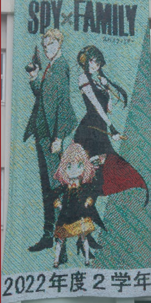
大成祭ネット壁画

貴志川の清掃、生石山での希少植物の保護、よみかたりなど、地域での様々な体験活動を通して豊かな心を育てます。