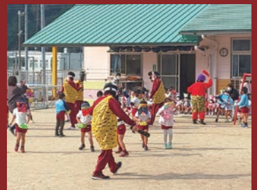
こども園節分ボランティア