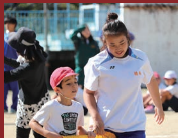
小川小運動会ボランティア