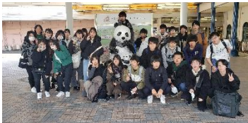
1年生はアドベンチャーワールド

12月10日(金)、1年生と3年生は、遠足を実施しました。1年生は白浜アドベンチャーワールド、3年生はUSJで楽しく1日を過ごしました。