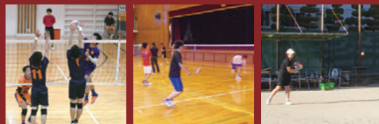
男子バレーボール部